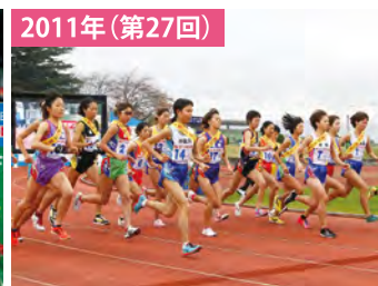
東日本大震災を乗り越え開催 被災3県合同「チーム絆」出場