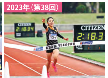
ドラマ生まれる最終9区 東京が宮城を逆転し優勝