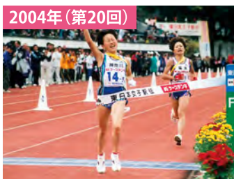
競技場での劇的ドラマ 神奈川が大逆転で優勝