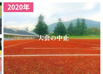
新型コロナウイルスまん延 大会史上初の中止