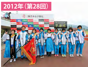
大会記録2時間16分16秒 神奈川が2連覇